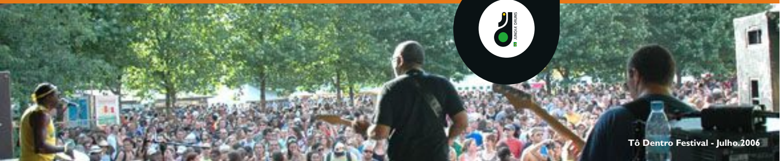
Tô Dentro Festival - Julho.2006